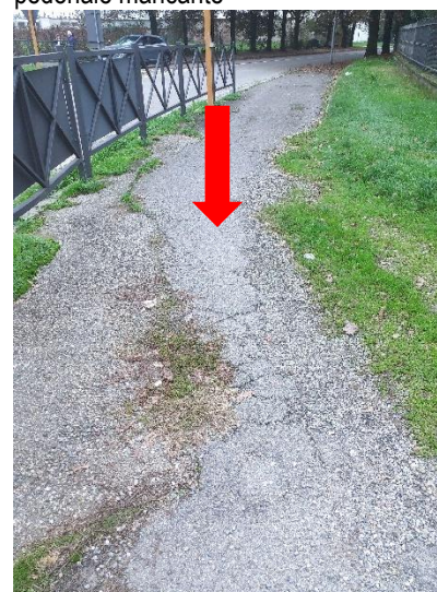
Foto 4 – Via dei Caduti – marciapiede con pavimentazione dissestata