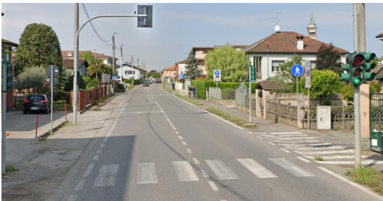
Impianto 3 – Incrocio Quasimodo – Indipendenza: Pedonale senza sbarchi accessibili