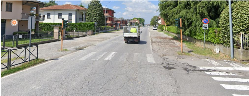
Impianto 1 – Pedonale con sbarchi non pavimentati – v. le Europa