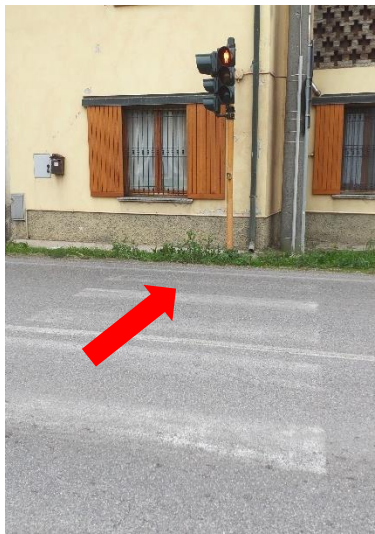
Foto 1 – Via Indipendenza – attraversamento pedonale: sbarco non pavimentato