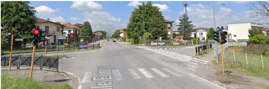
Impianto 1 – Pedonale: sbarchi non pavimentati