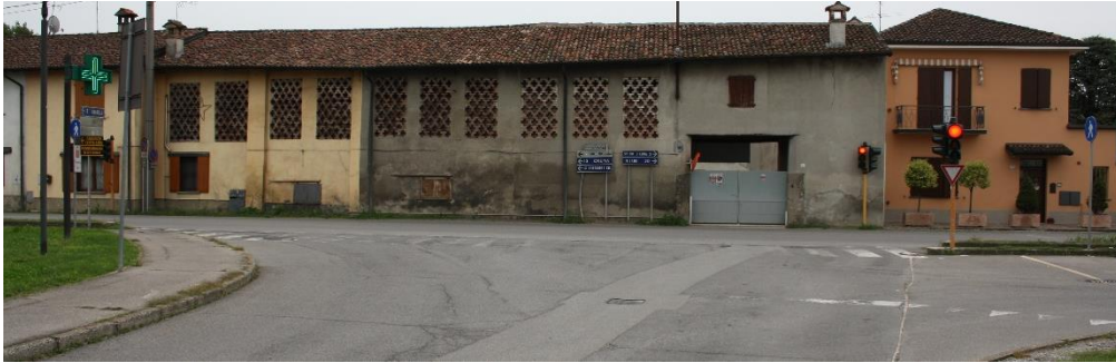
Impianto 4 - Incrocio Gradella – Indipendenza: attraversamento pedonale > 8 m