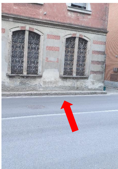
Foto 1 – Via Borgo Roldi – marciapiede con larghezza < 90 cm e dislivello