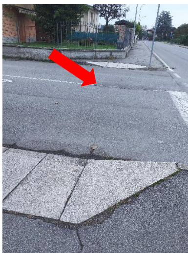
Foto 3 – Via Eroi dell'aria – attraversamento pedonale non segnalato