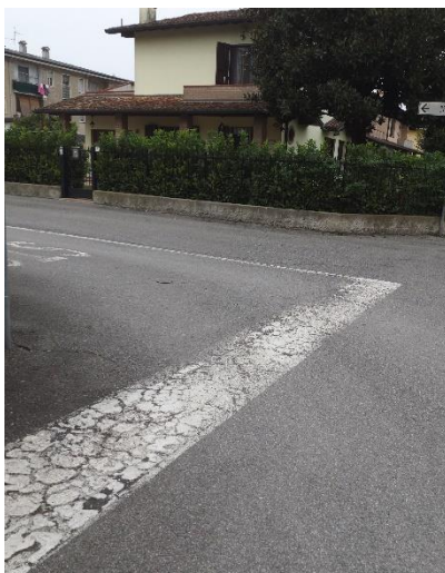
Foto 1 – Via Martiri della Libertà – attraversamento pedonale mancante