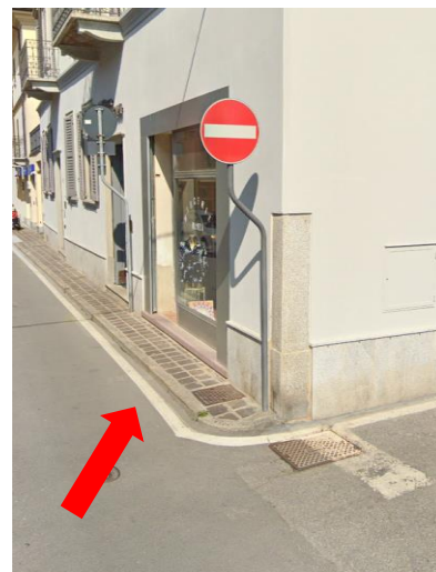
Foto 6 – Via Castello – marciapiede con larghezza < 90 cm e dislivello