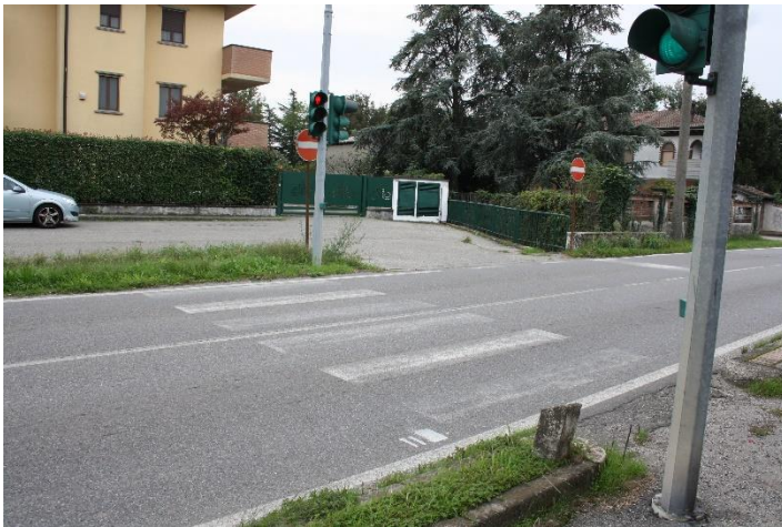
Impianto 7 - Pedonale senza sbarchi accessibili