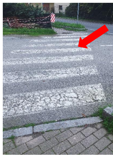
Foto 8 – Circonvallazione D – attraversamento pedonale con lunghezza > 8 m