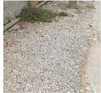
Foto 2 - Via Maggiore - banchina con pavimentazione non compatta