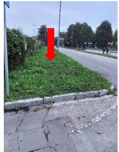
De Gasperi - pavimentazione mancante