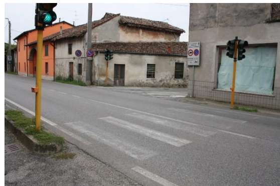
Impianto 4 - Incrocio Gradella: pedonale senza sbarchi accessibili Impianto 6 - Incrocio Barbuzzera: pedonale senza sbarchi accessibili