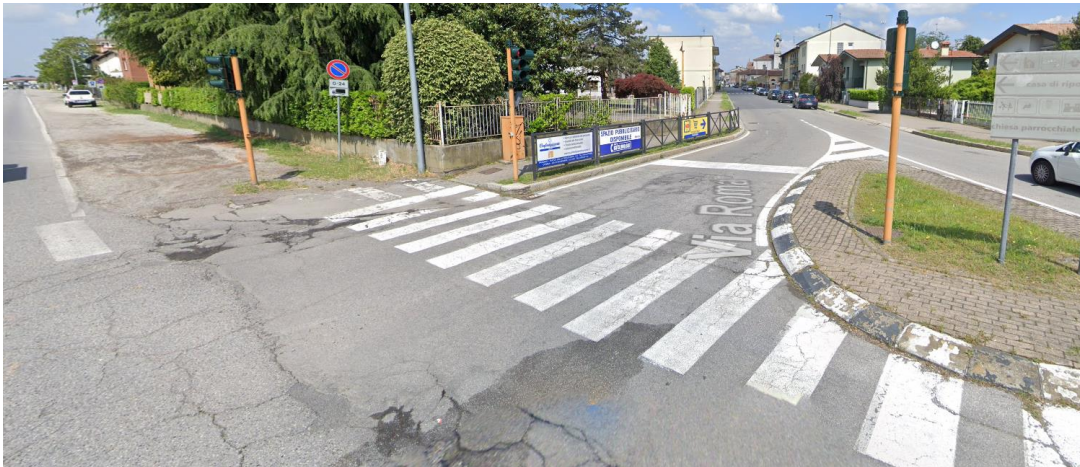
Impianto 1 – Pedonale con ostacolo – via Roma