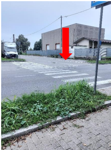
Foto 1 - De Gasperi - attraversamento pedonale con lunghezza > 8 m