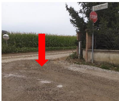
Foto 1 – Via Maggiore – attraversamento pedonale non pavimentato e non segnalato