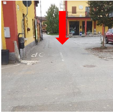
Foto 1 - Via Maggiore - segnaletica attraversamento pedonale mancante