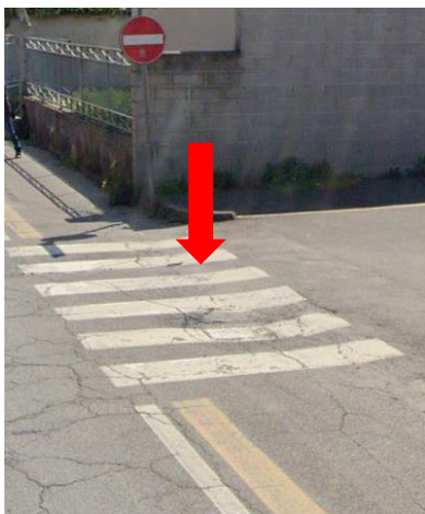
Foto 5 – Circonvallazione B – attraversamento pedonale con pavimentazione dissestata