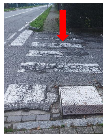
Foto 2 – Via Garibaldi – attraversamento pedonale con pavimentazione sconnessa