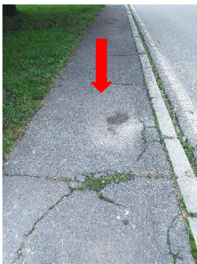
Foto 5 – Via dei Caduti - marciapiede con pavimentazione dissestata