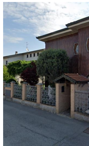
Foto 2 – Via Martiri della Libertà - Percorso pedonale non segnalato