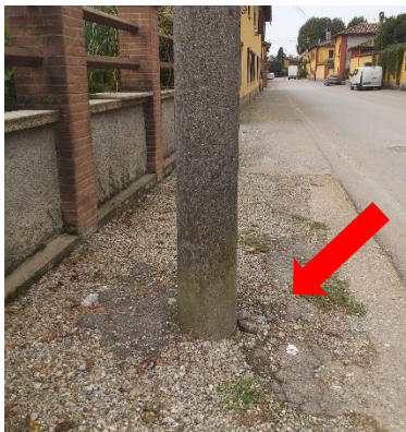
Foto 3 - Via Maggiore - ostruzione nella sezione di passaggio